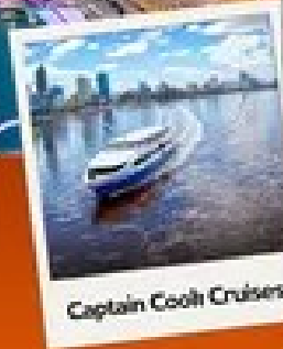
Captain Cook Cruises