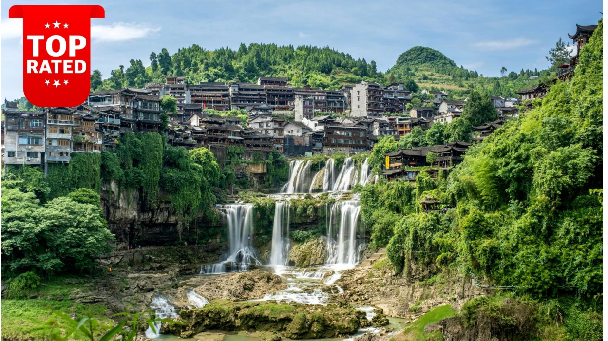
ทัศนียภาพของเมืองโบราณผู่หรงยามราตรี

ค่า บริการอาหารค่ำ ณ ภัตตาคาร ที่พัก XIANGRONG HOTEL หรือ เทียบเท่าระดับ 4 ดาว, เมืองผู่หรง