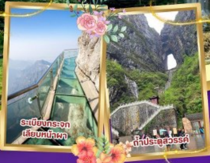
ระเบียงกระจก เลียบหน้าผา