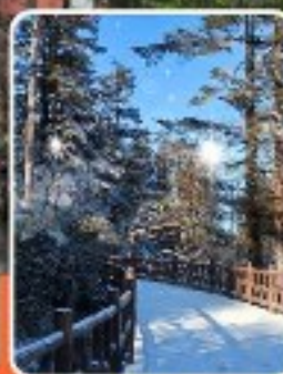
ภูเขาหวาอูซาน