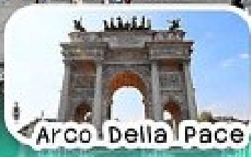
Arco Della Pace

เที่ยว มิลาน-เจนีวา-ปίζา-ฟลอเรนซ์- โบโลญญา-โคโม ตั๋วเครื่องบินขากลางคืนโรม-ทะเลสาบโคโม ชมหอเอนปίζาและมหาวิหารแห่งฟลอเรนซ์ ชิมพิซซ่าและพาสต้าสไตล์อิตาลีเยี่ยมแก่ๆ ช้อปปิ้งแบรนด์ดังอย่างจุใจที่มิลาน Galleria Vittorio Emanuele II และ Fidenza Village Outlets