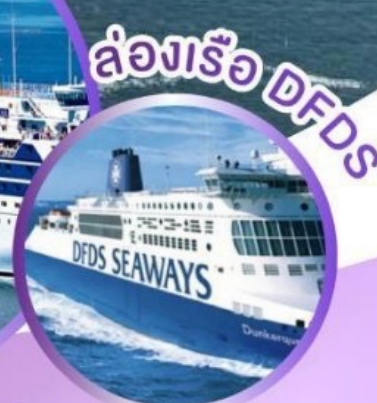
ล่องเรือ DFDS