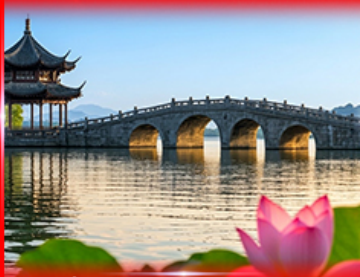
เที่ยวชมวิวกุหลาบสีชมพู