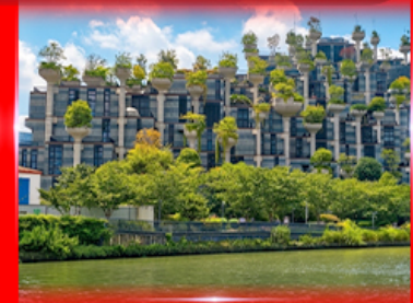
ตึก 1,000 ต้นไม้