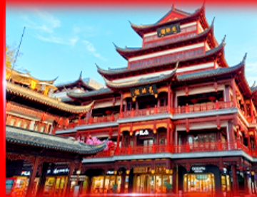
ตลาดร้อยปี เจิงหวังเมียว