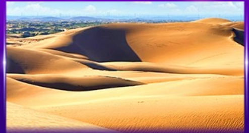
ทะเลทรายอินเคินทาลา