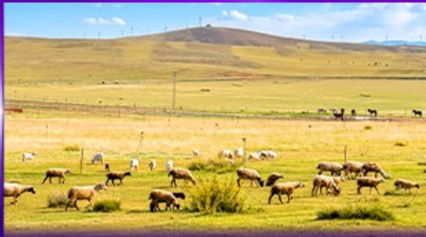
ทุ่งหญ้าซิลามูเหริน