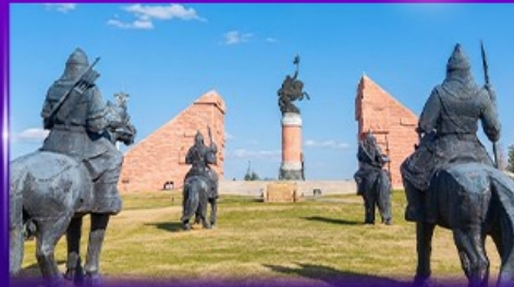
สวนสาธารณะเจงกิสข่าน