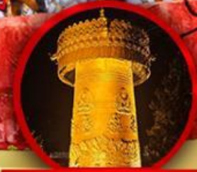
วัดต้าฝื่อ (ทองหล่อทองคำ)