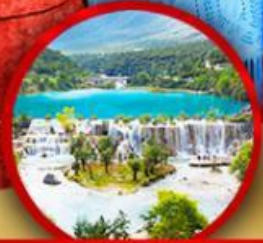
หุบเขาพระจันทรสีน้ำเงิน