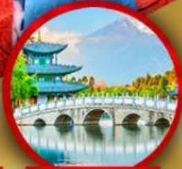
สระมิงกรดำ