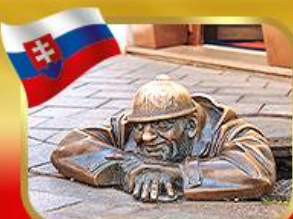
เข็ชอินคู้คูมิลเมืองบาติสลาวา