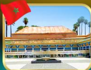
พระราชวังบาเฮีย