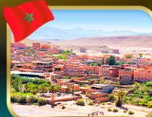
เมือง ไอท์ เบนฮัดดู