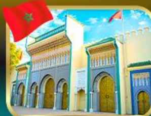
ประตูพระราชวังหลวง