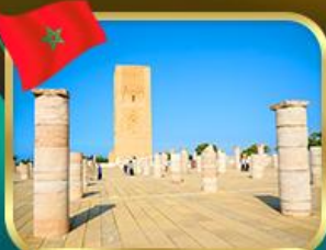
หอคอยอัลฮัน ราบัต