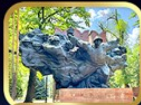
Panfilov Guardsmen Park