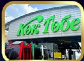
ซินโกกโทเบมวิอัลมาตี

นั่งกระเช้าชิมบุลัก • ทะเลสาบโคลโซ • ชารินเกรนด์แคเนยอน