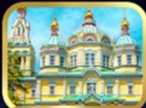
มหาวิหารเซนต์สเปียร์ อลมาตี