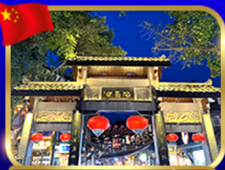
หมู่บ้านโบราณฉือซีโซ่ว