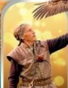
SUNKAR FALCONRY ALMATY