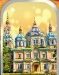
ASCENSION CATHEDRAL ALMATY