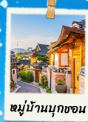
หมู่บ้านนุกซอน