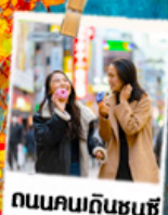
ถนนคนกินชุนซ์