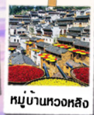
หมู่บ้านทวงหลิง