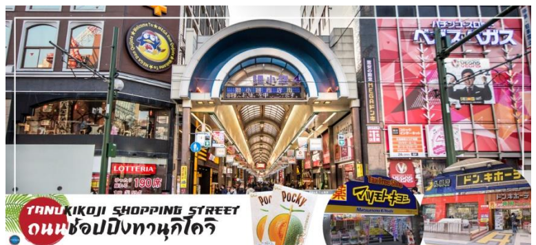
TANUKIKOJI SHOPPING STREET ถนนช้อปปิ้งทานุกิโคจิ

จากนั้นนำท่านสู่ ถนนช้อปปิ้งทานุกิโคจิ (Tanukikoji Shopping Street) เป็นย่านการค้าเก่าแก่ของเมืองซัปโปโร โดยมีพื้นที่ทั้งหมด 7 บล็อก ภายในนอกจากจะเป็นแหล่ง รวมร้านค้าต่างๆ อย่างร้านขายกิโมโน เครื่องดนตรี วิดีโอ โรงภาพยนตร์ แล้ว ยังมีร้านอาหารมากมาย ทั้งยังเป็นศูนย์รวมของเหล่าวัยรุ่นด้วย เนื่องจากมีเกมเซ็นเตอร์และตู้หนีบตุ๊กตามากมาย ร้านดองกิ ร้าน 100 เยน นอกจากนี้ที่นี่ยังมีการตกแต่งบนหลังคา