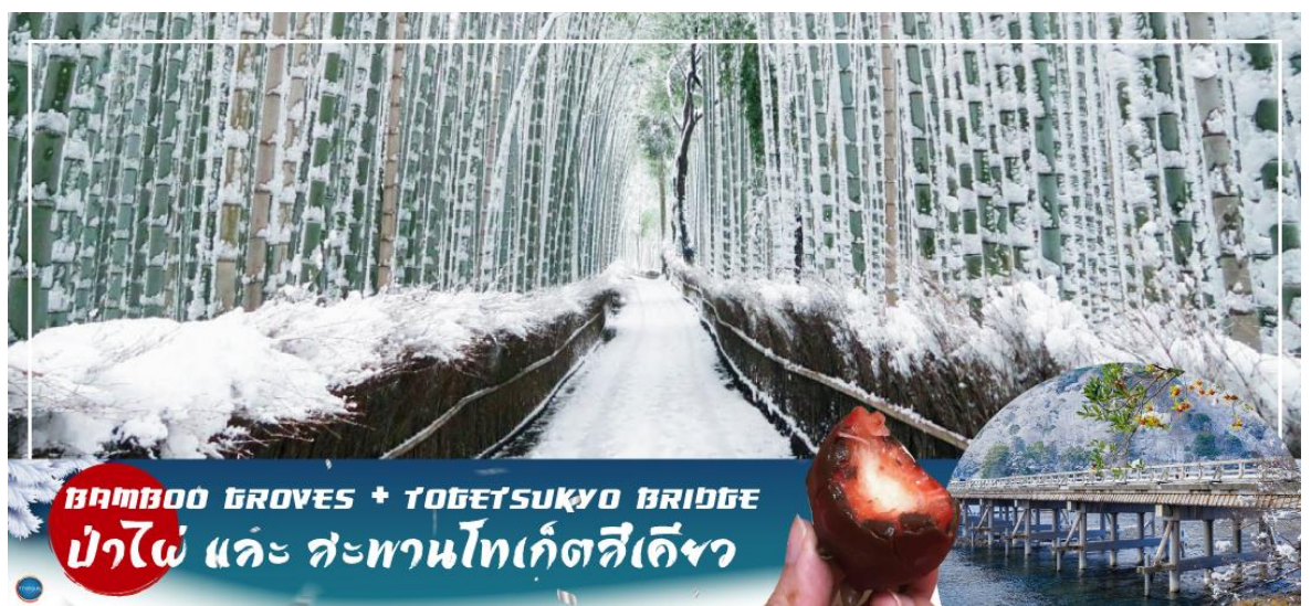
BAMBOO GROVES + TOGETSUKYO BRIDGE ป่าไผ่ และ สะพานโทเก็ตสึเคียว

เที่ยง รับประทานอาหารกลางวัน ณ ภัตตาคาร (4)