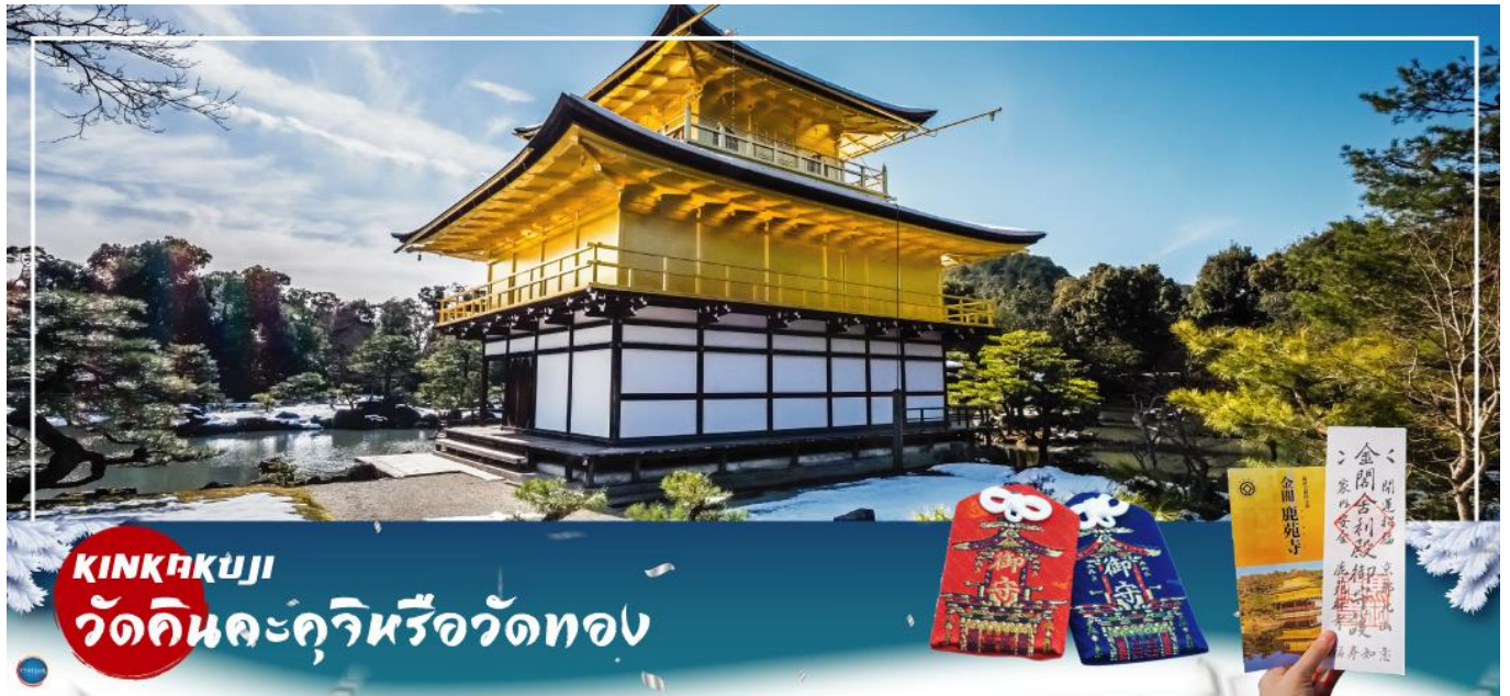
KINKAKUJI วัดคินคะคุจิหรือวัดทอง

วันที่สาม เมืองโอซาก้า – เมืองเกียวโต – วัดคินคะคุจิ – การเรียนพิธีชงชาญี่ปุ่น อาราชิยาม่า – สวนป่าไผ่ – สะพานโทเก็ตสึเคียว – เมืองโอซาก้า – ช้อปปิ้งชินไซบาชิ