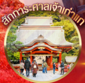
สักการะศาลเจ้าเก่าแก่