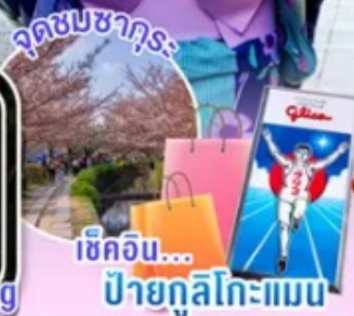
ช้อปปิ้ง... ป้ายกูลิโกะแบบ