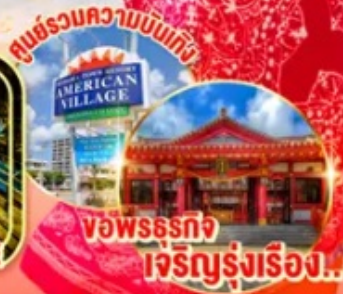
ชมพร้อมความบันเทิง พิพิธภัณฑ์อเมริกันวิลเลจ พิพิธภัณฑ์เจริญรุ่งเรือง!