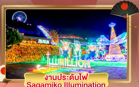
งานประดับไฟ Sagami Illumination