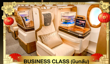
BUSINESS CLASS (บินกลับ)

น้ำหนักกระเป๋า ขาไป 30Kg. | ขากลับ 40Kg.