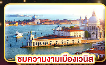
ชมความงามเมืองเวนิส