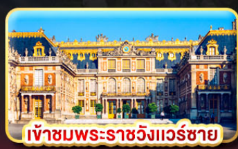
เข้าชมพระราชวังแวร์ซาย