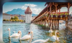
สะพานไม้ซาเปล