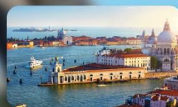
ชมความงามเมืองเวนิส