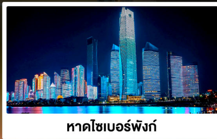
หาดไซเบอร์ฟังก์