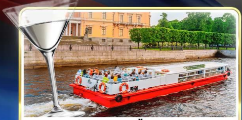
ล่องเรือแม่น้ำวอวา พร้อมลิ้ม Vodka Tasting

📅 เดินทาง : 14-21 มิ.ย.69 / 28 มิ.ย.-05 ก.ค.69 / 24-31 ก.ค.69