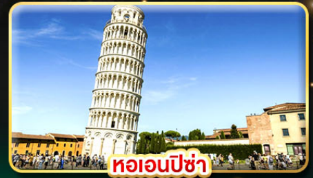
หออนพีซ่า