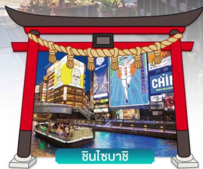
ชินโซบาชิจิ

เดินทางโดยสายการบินแอร์เอเชียเอ็กซ์ 🍴 อาหาร : 6 มื้อ 🏨 โรงแรม : 3 ดาว