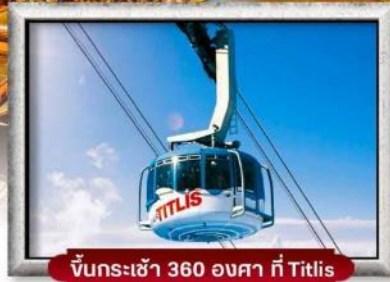
ขึ้นกระเช้า 360 องศา ที่ Titlis