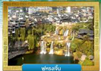
พูรงเจิน