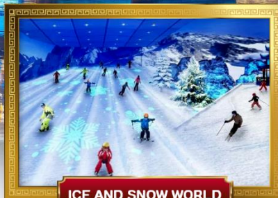
ICE AND SNOW WORLD