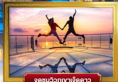
จุดชมวิวกูเขาเจ็ดดาว