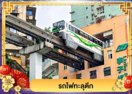
รถไฟฟ้า-ลู่ตีก