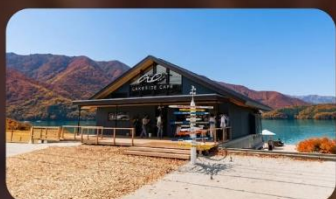
AO Lakeside Cafe'

HOTEL NARITA AREA หรือเทียบเท่ามาตรฐานญี่ปุ่น