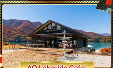
AO Lakeside Cafe'