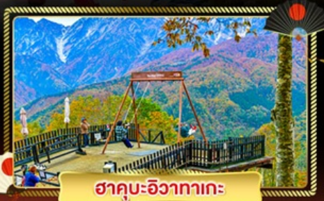
ฮาคุมะ-อิซากาตะ