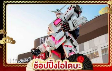
ช้อปปิงโอไดบะ