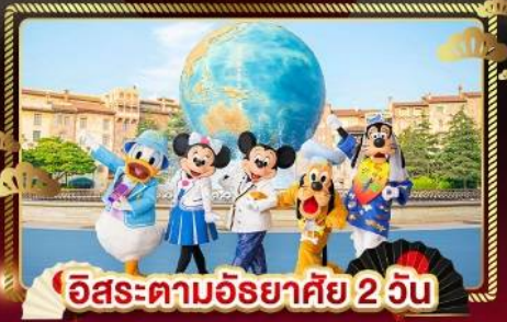
อิสระตามอริยาศัย 2 วัน