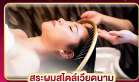
สปาพรีเมียมเวียดนาม