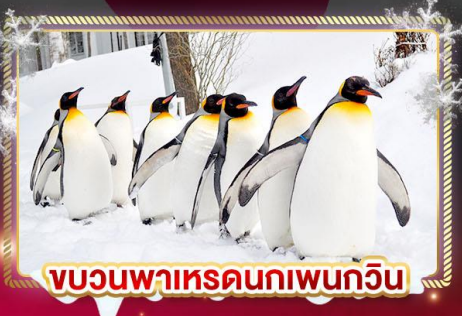
ขบวนพาเหรดนกเพนกวิน