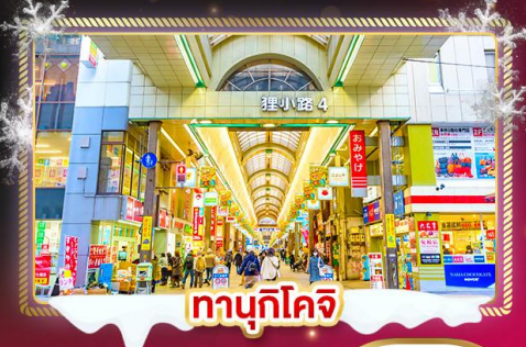
ทานุกิโจจิ