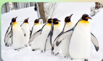
ขบวนพาเหรดนกเพนกวิน