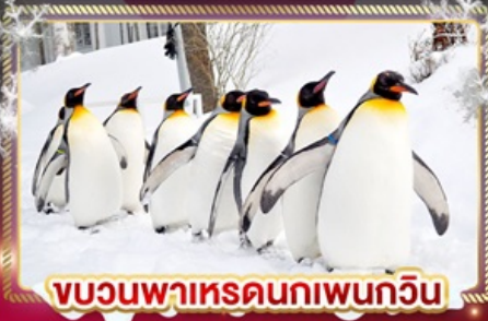
ชมวนพาเหรดนกเพนกวิน