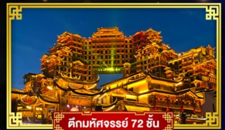
ตึกมหิศวรรษย์ 72 ชั้น