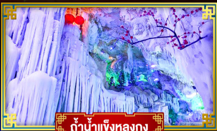
ถ้ำน้ำแข็งหลงกง

"เที่ยว 2 มณฑล กวางสี-กวางโจว" สุดอลังการ น้ำตก 2 พรมแดน แหล่งท่องเที่ยวระดับ 5A