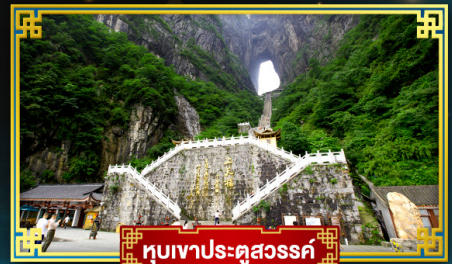
ภูเขาประจูดสวรรค์