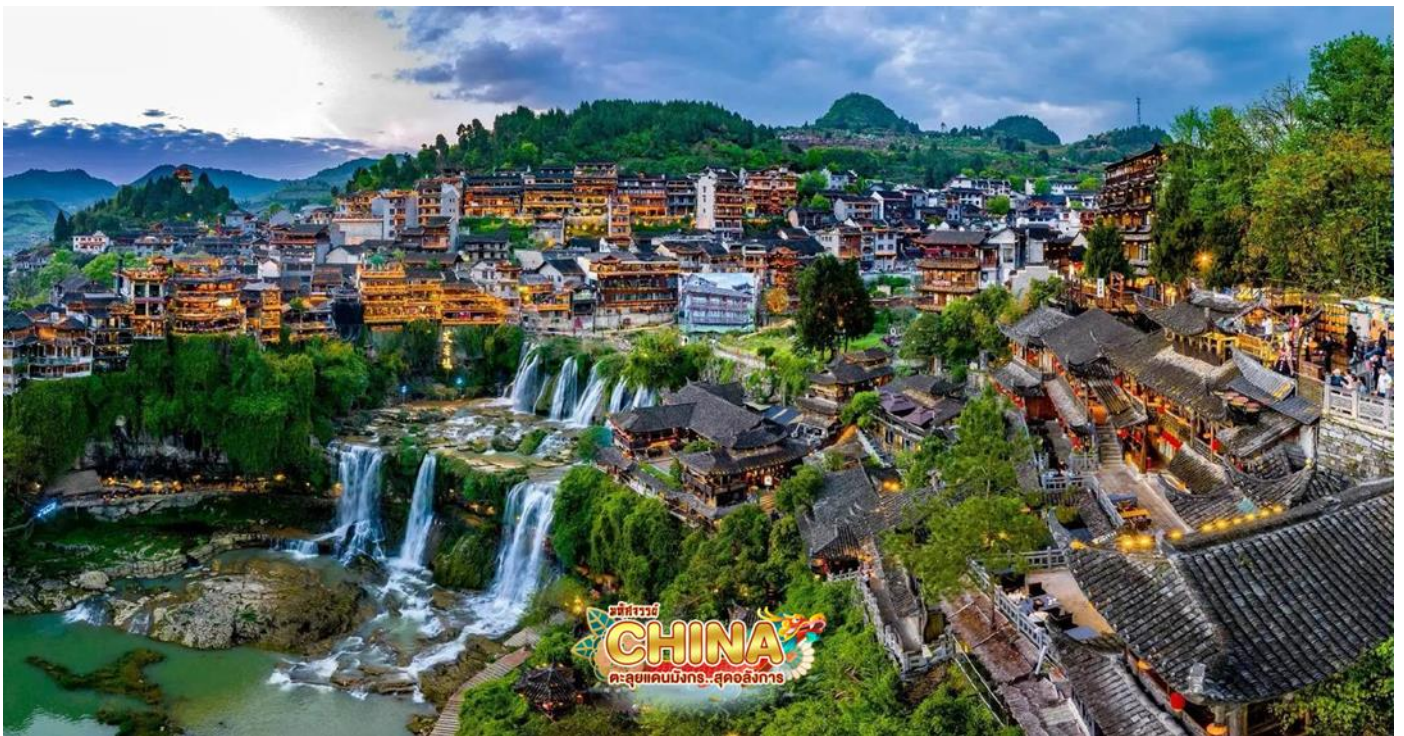
(หมายเหตุ: ปริมาณน้ำตก ขึ้นอยู่กับสภาพอากาศและฤดูกาล)

จากนั้น นำท่านเดินทางสู่ เมืองพุทธรังเงิน (ใช้เวลาเดินทางประมาณ 2-3 ชั่วโมง) สถานที่อันเป็นที่ตั้งของหมู่บ้านโบราณริมน้ำตกในมณฑลหูหนาน เปี่ยมไปด้วยเสน่ห์ของสถาปัตยกรรมเก่าแก่คละเคล้ากับความสวยงามของธรรมชาติอย่างลงตัว ประชากรส่วนใหญ่ที่อาศัยอยู่จะเป็นชนกลุ่มน้อยเผ่าตู่เจียว บ้านเรือนในเมืองโบราณแห่งนี้จะมีลักษณะเป็นอาคารไม้สไตล์จีนโบราณ และมีน้ำตกขนาดใหญ่ 2 ชั้น ตั้งอยู่ใจกลางหมู่บ้าน เดิมเคยเป็นแค่เมืองเล็กๆ ซึ่งภายหลังหมู่บ้านถูกใช้เป็นสถานที่ถ่ายทำภาพยนตร์ HIBISCUS TOWN จึงกลายมาเป็นที่นิยมของนักท่องเที่ยว