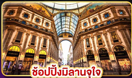
ช้อปปิ้งมิลานจุใจ

มากกว่าการท่องเที่ยว แต่ได้พักผ่อนเต็มที่ โปรแกรมไม่รีบเร่ง