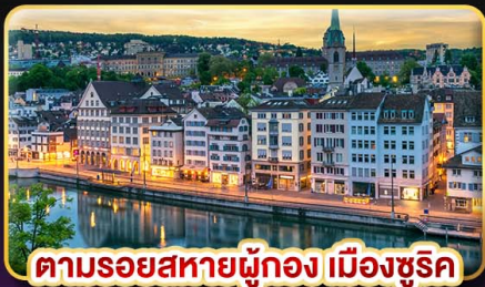
ตามรอยสหายผู้ทอง เมืองซูริค