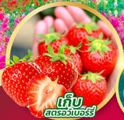
เก็บ สตรอว์เบอร์รี่