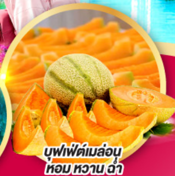
บุฟเฟ่ต์เมล่อน หอมหวาน ฉ่ำ