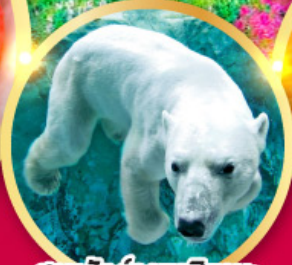
สวนสัตว์อาซาฮิยามะ