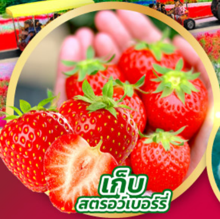
เก็บ สตอร์วเบอร์รี่