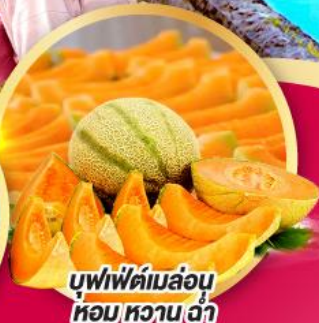
บุฟเฟ่ต์เมล่อน หอมหวานซ่า