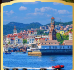
ท่าเรือประมงต้าเหลียน