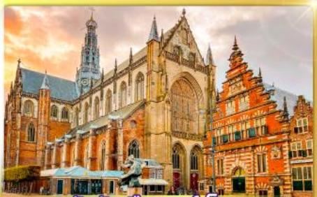
จัตุรัสเมืองฮาร์ลิม

พรมแดนเมืองเปลาเนเธอร์แลนด์และเบลเยียม เดินเมืองเคลฟท์ เมืองเครื่องปั้นดินเผาระดับโลก ฮาร์ลิมเมืองมั่งคั่งที่สุดของเนเธอร์แลนด์