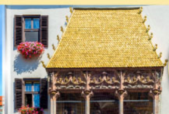
หลังคาทองคำอินน์สbruck