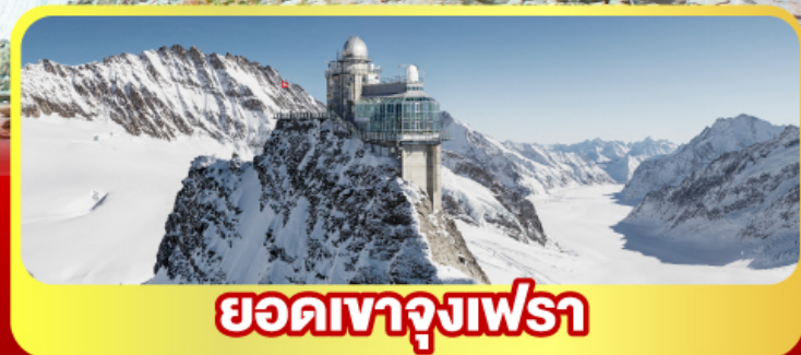
ยอดเทาจุงเฟรา