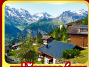
หมู่บ้านเมอร์เรน