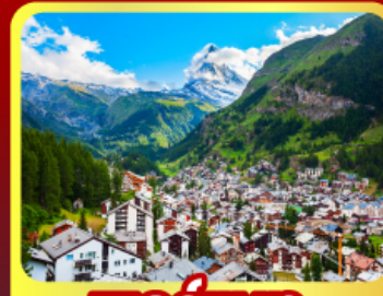
เชอร์แมนท์