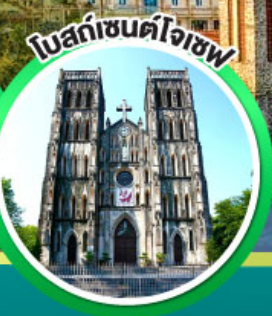
โบสถ์ซันต์โจเซฟ