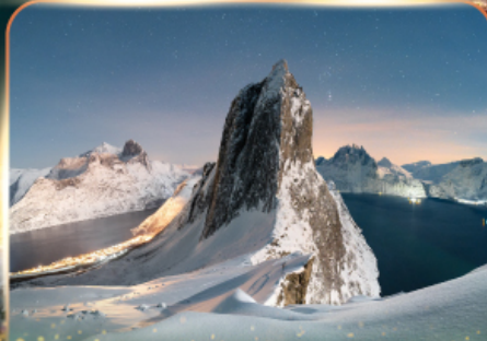
เกาะเซนญา