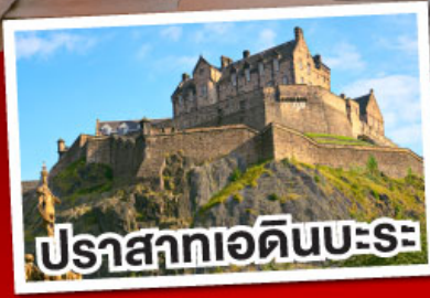
ปราสาทเอдинบะระ