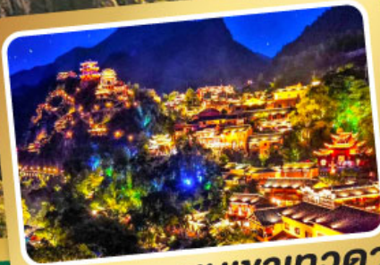
หุบเขาเทวดา