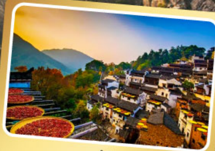
หมู่บ้านหวงหลิง