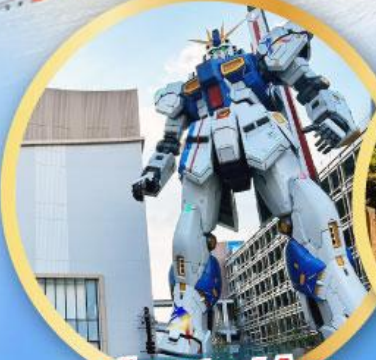
กันดั้ม ปาร์ค ฟุกุโอกะ

เดินทาง 09-13, 16-20, 23 -27 ม.ค.68 06-10,13-17, 20-24 ก.พ. 68 07-10 มี.ค. 68