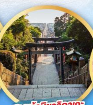
ศาลเจ้ามียาจิดากะ