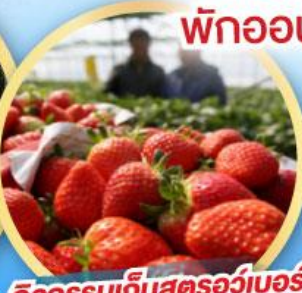
กิจกรรมเก็บสตอว์เบอร์รี่